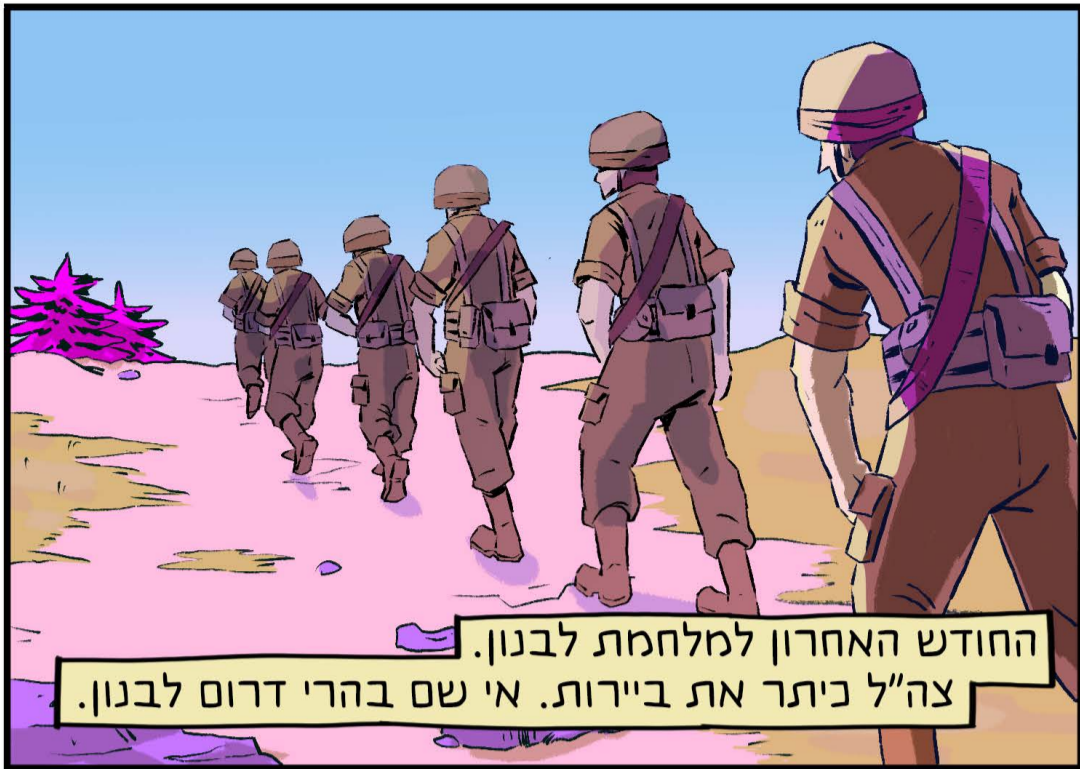
החודש האחרון למלחמת לבנון. צה"ל כיתר את ביירות. אי שם בהרי דרום לבנון.